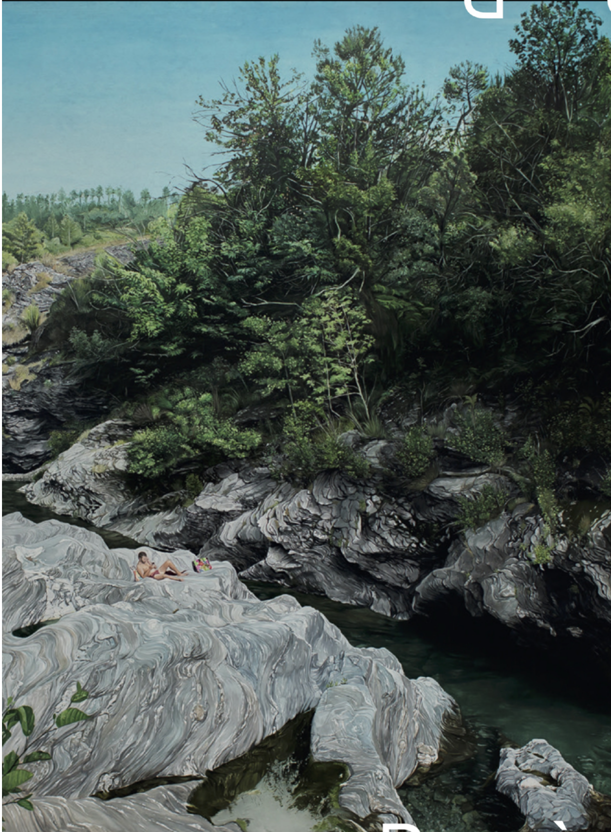
VACANCE, HUILE SUR TOILE, 180 x 180 CM.