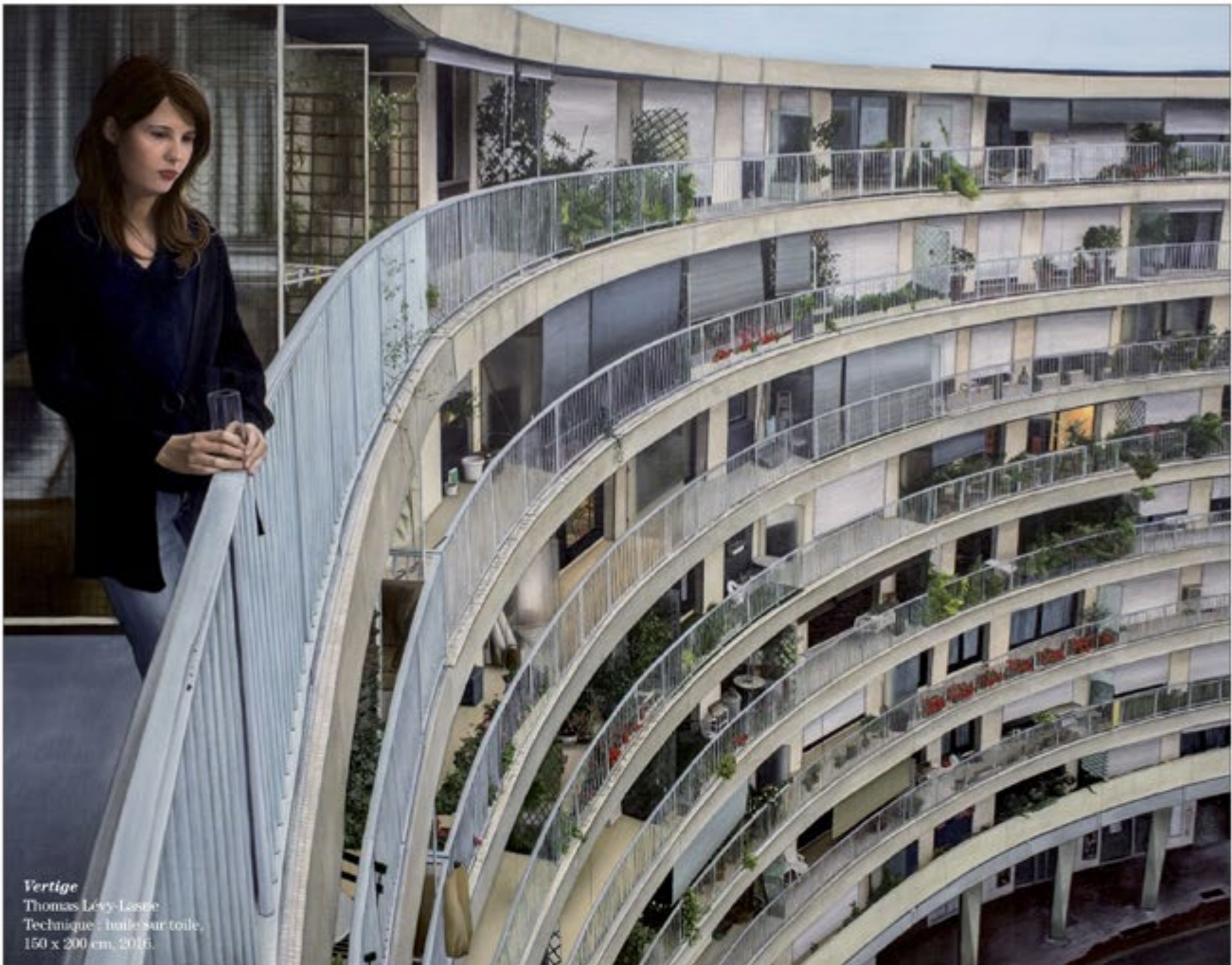
Vertige Thomas Lévy-Lasne Technique : huile sur toile, 150 x 200 cm, 2016.