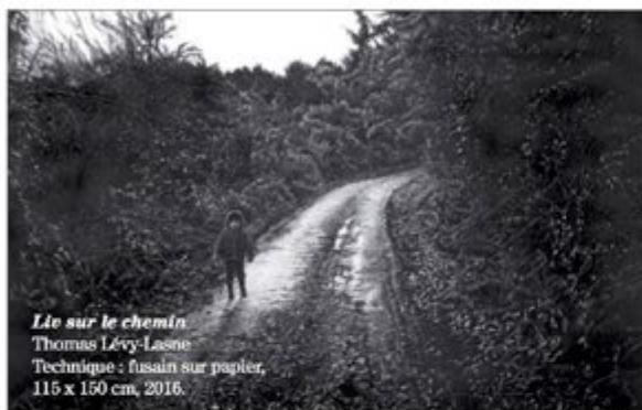
Lit sur le chemin Thomas Lévy-Lasne Technique : fusain sur papier, 115 x 150 cm, 2016.