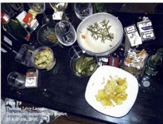
Fête 79 Thomas Lévy-Lasne Technique : aquarelle sur papier, 15 x 20 cm, 2016.