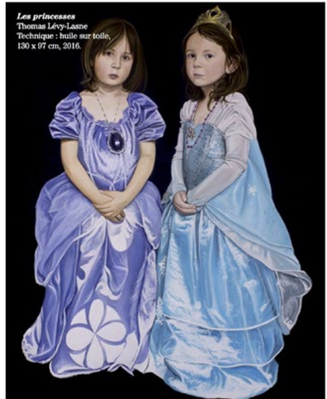
Les princesses Thomas Lévy-Lasne Technique : huile sur toile, 130 x 97 cm, 2016.