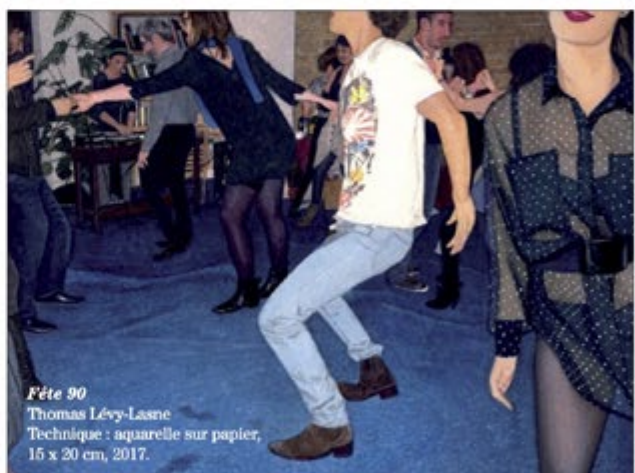
Fête 90 Thomas Lévy-Lasne Technique : aquarelle sur papier, 15 x 20 cm, 2017.

“ Quand il y a eu Charlie, je me suis demandé comment réagir. J’ai continué de faire ce que je faisais déjà : montrer une vie occidentale où les hommes et les femmes sont égaux, [...] avec sa joie et sa mélancolie. ”